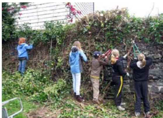
Skoleelever rydder kulturminne, Nordnes skole i Bergen.

Tidligere år har vi gjennom samarbeid med Sparebankstiftelsen DnB NOR, kunnet tilby hver deltakergruppe et stipend på kr 3000 for sin innsats. Disse